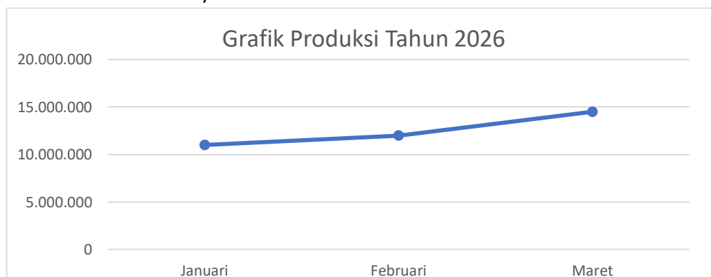
Gambar 3. Grafik Produksi Tahun 2026

Berdasarkan data produksi pada periode Januari hingga Maret 2026, terlihat adanya tren peningkatan hasil produksi yang konsisten setiap bulannya. Pada bulan Januari, jumlah produksi tercatat sebesar 11.000.000. Kemudian pada bulan Februari, produksi mengalami kenaikan menjadi 12.000.000, atau meningkat sebesar 1.000.000 dari bulan sebelumnya.