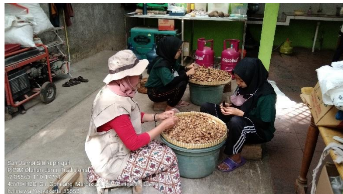
Gambar 6. Tenaga kerja dalam Proses produksi