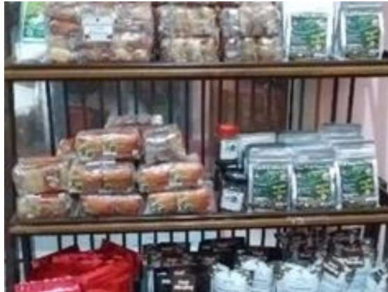
Gambar 5. Produk Ekonomi Lokasi KTH Sari Jampi