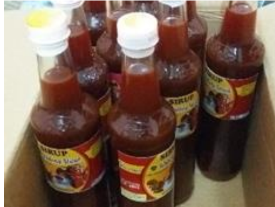
Gambar 1. Produk Hasil KTH Sari Jampi

Kedua, peningkatan permintaan tersebut direspons oleh KTH Sari Jampi melalui penyesuaian kapasitas produksi. Anggota kelompok meningkatkan volume produksi dengan memanfaatkan sumber daya lokal dan tenaga kerja keluarga. Hal ini sejalan dengan karakteristik usaha kecil berbasis masyarakat yang fleksibel dalam merespons perubahan permintaan pasar (Badan Pusat Statistik, 2023). Diversifikasi produk dan inovasi kemasan juga menjadi strategi penting untuk meningkatkan daya saing, terutama dalam menghadapi pasar musiman dengan tingkat persaingan yang tinggi.